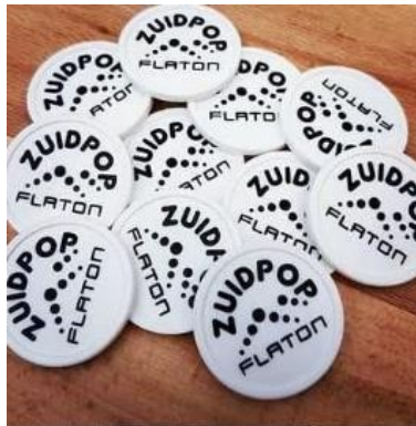
Afbeelding: Consumptiemuntjes Zuidpop 2018

Dit pakket is een uitbreiding van sponsorpakket C en geeft de sponsor tevens het recht om haar eigen logo op het Zuidpop consumptiemuntje te laten plaatsen. Het gaat hier dan om een oplage van 1.000 stuks. De sponsor dient zelf een hoge resolutie logo aan te leveren bij de organisatie van Zuidpop. De organisatie van Zuidpop zorgt voor de uitvoering, productie van de consumptiemuntjes met logo.